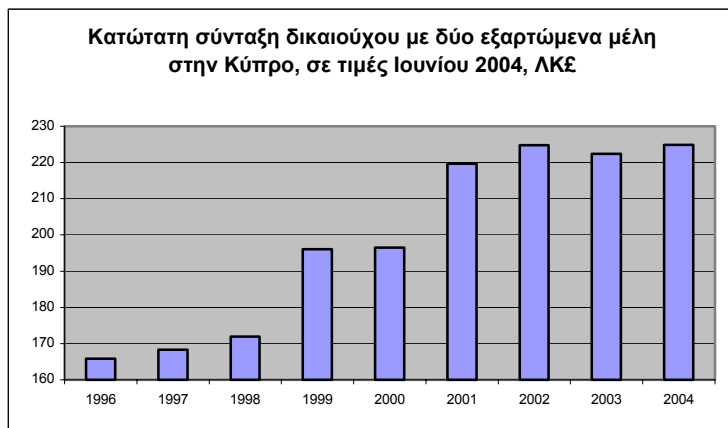
Διάγραμμα 3.1: Κατώτατη σύνταξη δικαιούχου με δύο εξαρτώμενα μέλη στην Κύπρο, σε τιμές Ιουνίου 2004, ΛΚ£

Για τους μελλοντικούς συνταξιούχους, σημαντικότερο πρόβλημα είναι, συνεπώς, η βιωσιμότητα του συστήματος και το θέμα του εκσυγχρονισμού . Ο λόγος είναι ότι η βιωσιμότητα η οποία μετατρέπει την θεωρητική δυνατότητα υψηλής αναπλήρωσης σε πράξη και επομένως είναι η βιωσιμότητα του συστήματος που κατοχυρώνει την κεντρική επιδίωξη του συστήματος ασφάλισης – την εμπέδωση ενός αισθήματος ασφάλειας εμπρός στην αβεβαιότητα των γηρατειών. Η Έκθεση του Αναλογιστή για το 2000, αναφέρει μια σειρά μέτρα για την τόνωση της βιωσιμότητας του Ταμείου Κοινωνικών Ασφαλίσεων συντάξεων, μεταξύ των οποίων η κατάργηση του δικαιώματος συνταξιοδότησης πριν από το 65 ο έτος. Η εξασφάλιση του ζητήματος αυτού αποτελεί αλληλένδετο θέμα με την επάρκεια των συντάξεων. Η αναζήτηση της χρυσής τομής μεταξύ επάρκειας, βιωσιμότητας και εκσυγχρονισμού είναι το κεντρικό ζητούμενο στην Έκθεση Εθνικής Στρατηγικής για τις Συντάξεις που θα κατατεθεί στην ΕΕ εντός του 2005. Η αντιμετώπιση του θέματος στο παρόν ΕΣΔΕν λαμβάνει αυτό υπόψη και επικεντρώνει περισσότερα σε άλλες συνιστώσες της ενσωμάτωσης.